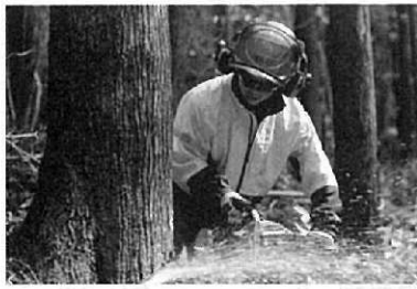
大隅流域森林・林業活性化センター