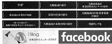
大隅流域森林・林業活性化センターのホームページ